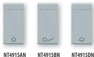
NT4915AN NT4915BN NT4915DN

Nota: estas cubreteclas se pueden instalar en sustitución de las cubreteclas originales en los mecanismos de mando basculantes con o sin cubreteclas incluidas.