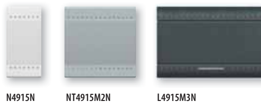
N4915N NT4915M2N L4915M3N

Nota: estas cubreteclas se pueden instalar en sustitución de las cubreteclas originales en los mecanismos de mando basculantes con o sin cubretecla incluido.