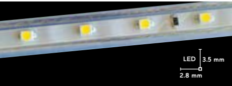
Manguera plana de LED 3528 SMD 2 hilos