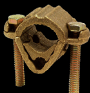
13-25 mm Cobre - bronce Peso: 300 g CAT.-AME-027