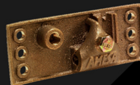
Para techo de lámina Cobre - bronce Peso: 340 g CAT.-AME-008