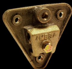
Triangular Cobre - bronce Peso: 420 g CAT.-AME-005