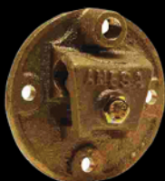
Redonda Cobre - bronce Peso: 340 g CAT.-AME-006