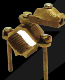
38-51 mm Cobre - bronce Peso: 630 g CAT.-AME-026