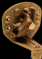
De pretil Cobre - bronce Peso: 360 g CAT.-AME-007