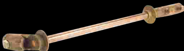
Pasa-losa Cobre - bronce Peso: 580 g CAT.-AME-029